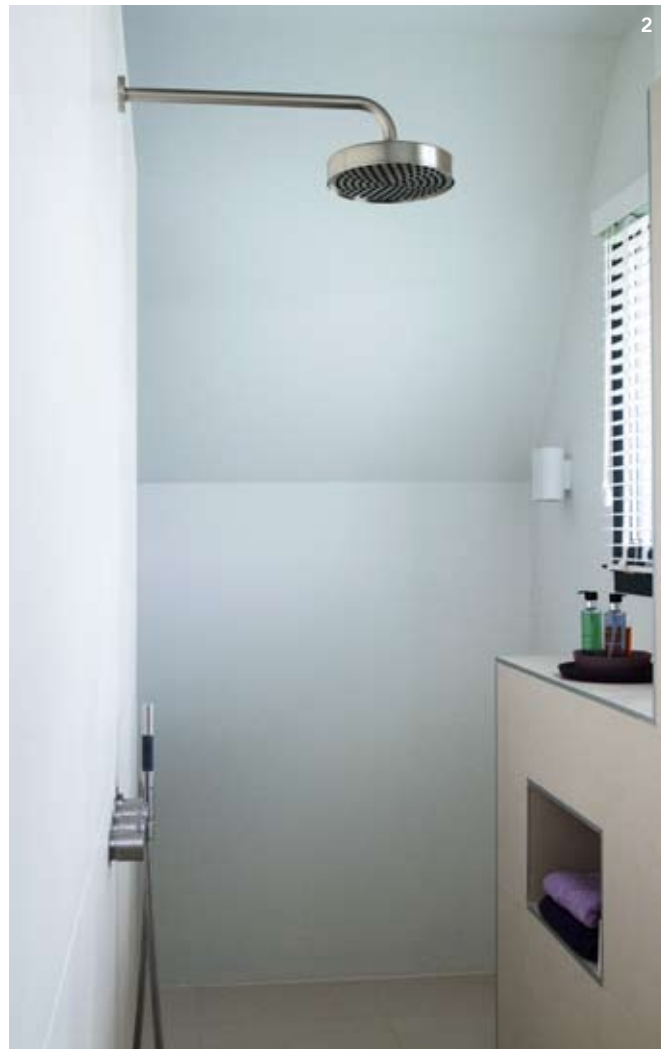
1 Zicht vanuit het slaappedeelte op het bad, model Paris van Baden Baden, € 3.612. De vrijstaande kraan en inbouw douchemengkraan zijn van Vola, v.a. € 854. Het krukje komt van Baden Baden, € 75. 2 Detail van de doucheruimte met een hoofddouche en handdouche van Vola, v.a. € 854. 3 Detail van het op maat gemaakte wastafelmeubel, prijs op aanvraag. De vaas is van Rina Menardi, de handdoeken zijn van Abbyss Super Pile. 4 De Durat-wastafels op eikenhouten kasten zijn op maat gemaakt door Baden Baden (prijs op aanvraag). Lamp Nomad Linestra is afkomstig uit de collectie van Modular Lighting, € 355.